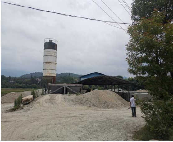
项目区现状及评价人员现场勘查照片