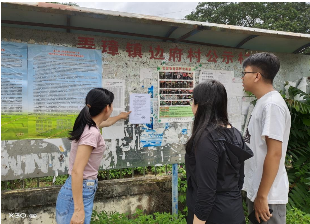
图6 第二次粘贴公示（边府村委会）