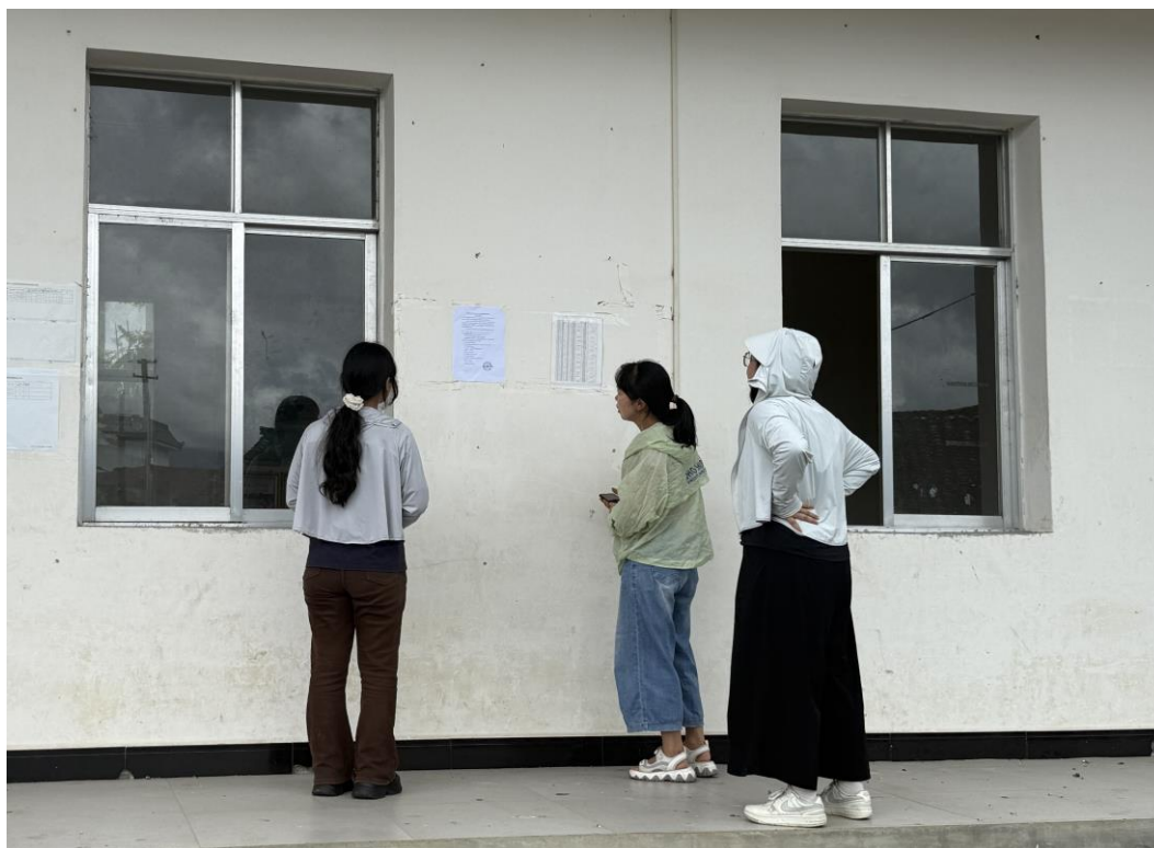
图7 第二次粘贴公示（新岗热村）