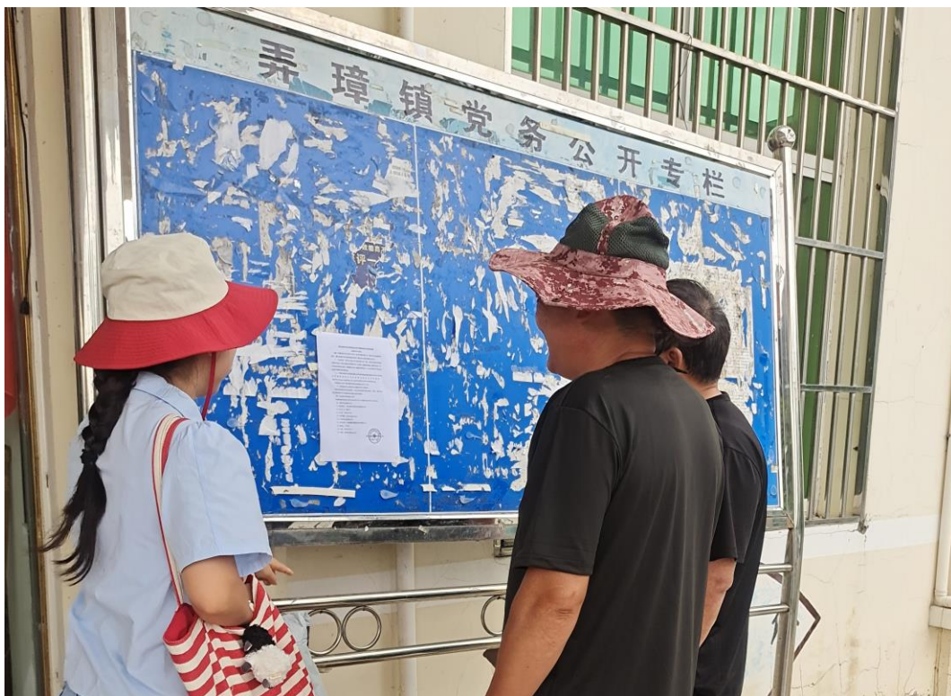
图5 第二次粘贴公示（弄璋镇）

2025年8月18日—2025年8月29日（公示时间10个工作日）在弄璋镇、边府村委会和新岗热村信息公示栏进行了张贴公示：