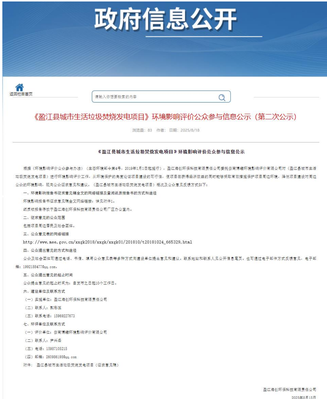
图 2 第二次网络公示截图